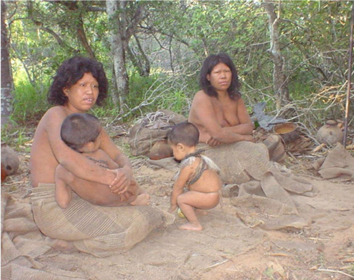
Miembros del grupo ayoreo-tobiegoso en Paraguay el día de su primer contacto en 2004.

Cada familia dispone de un fuego propio en el exterior. Sólo duermen dentro cuando llueve. El ritual ayoreo más importante recibe el nombre de asojna , el chotacabras . El primer canto de este ave anunciaba la llegada de la estación lluviosa y un mes de celebraciones y festejos.