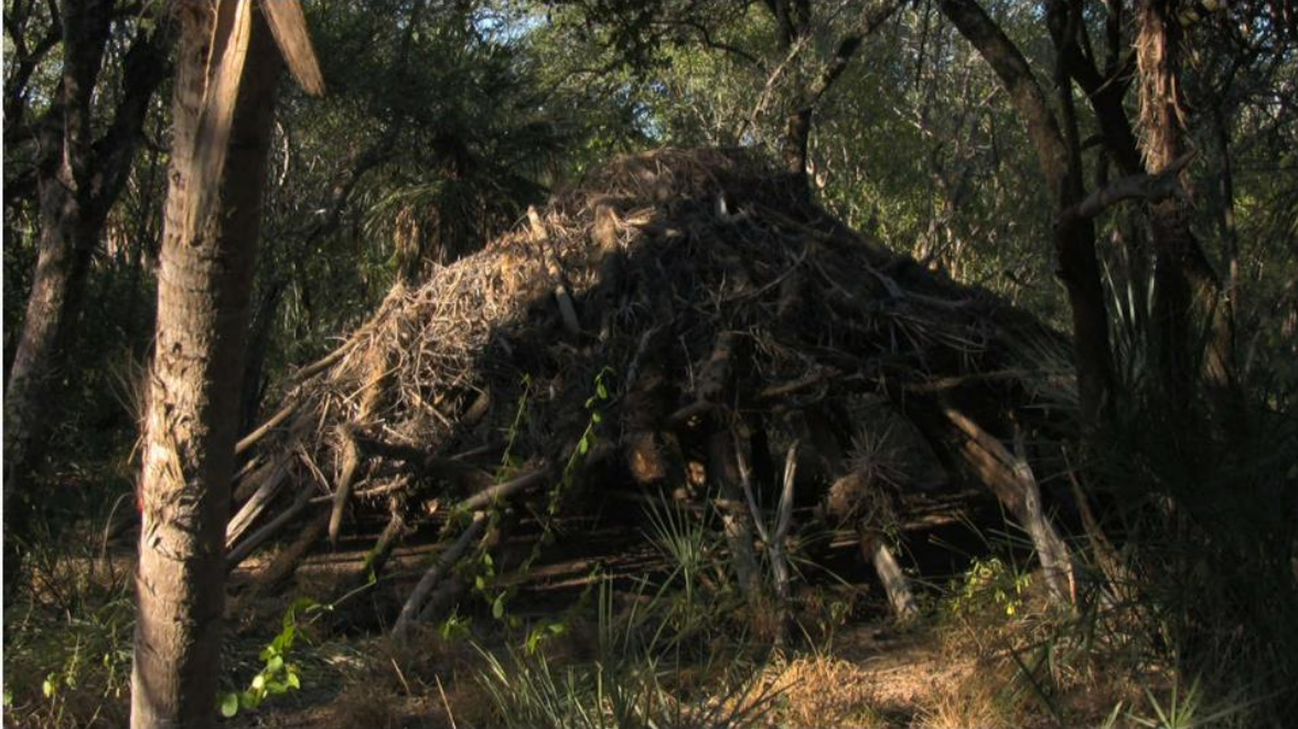
Una casa abandonada en el Chaco paraguayo perteneciente a indígenas aislados ayoreo-totobiegosodes.

Los ayoreo, que actualmente viven en comunidades sedentarias, habitan en cabañas individuales familiares. A quienes han perdido su tierra no les queda más elección que convertirse en explotados trabajadores de las haciendas ganaderas que han ocupado buena parte de su territorio.