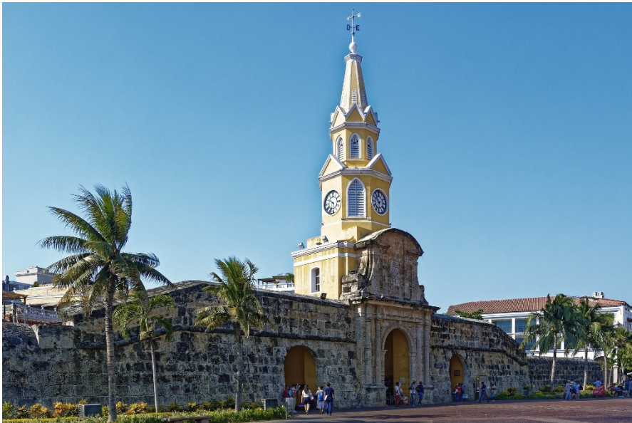
Muralla de Cartagena.

Dentro de las tres áreas principales de trabajo de la Fundación “la prevención, la investigación y la atención directa a las víctimas”, enumera Castro, destacamos, en primer lugar, su participación como representante local del sello internacional The Code y la estrategia promovida por Renacer Cartagena “ La muralla soy yo ”. Ambas con el objetivo de prevenir la ESCNNA en relación con el turismo y la creación de entornos seguros en la ciudad de Cartagena desde 2009.