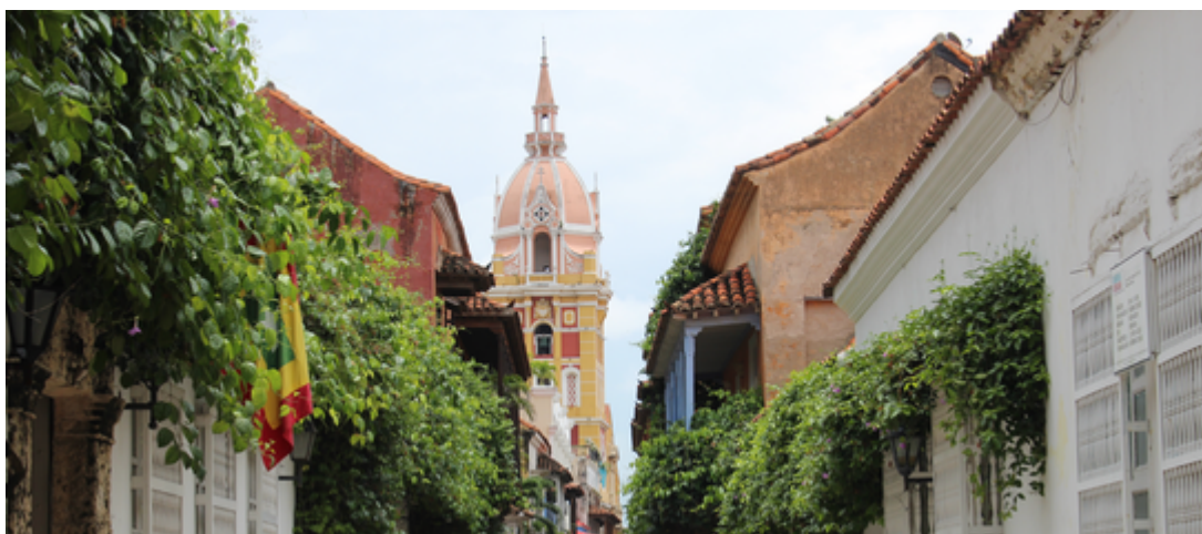
Calles de Cartagena.

A pesar de que el contexto turístico pueda favorecer ciertos delitos, Herrera es claro con que “el turismo no es el culpable de la explotación”, sino una “ infraestructura donde se facilitan ciertas dinámicas ” y por ello la voluntad de “construir un turismo responsable en la debida diligencia de los derechos humanos”.