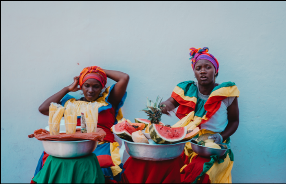
Palenqueras trabajando.

Respecto a Airbnb , en Colombia actualmente “algunos de estos apartamentos y residencias están empezando a figurar en el registro nacional de turismo”, explica Sergio Rivera, “aunque sigue siendo un porcentaje minúsculo”, ya que implica tener que cumplir con distintas exigencias fiscales y administrativas. A pesar de ello, Rivera anuncia que “ya han empezado la comunicación y a establecer contacto para que se vinculen a la estrategia”. De hecho, el diez de enero de este año, Airbnb anunció que ha firmado el código de conducta “The Code” de ECPAT . Este compromiso implica formar al personal de la plataforma, ampliar información para huéspedes y turistas sobre cómo identificar y denunciar posibles casos de ESCNNA, ampliar en este aspecto su código de ética para proveedores entre otras acciones.