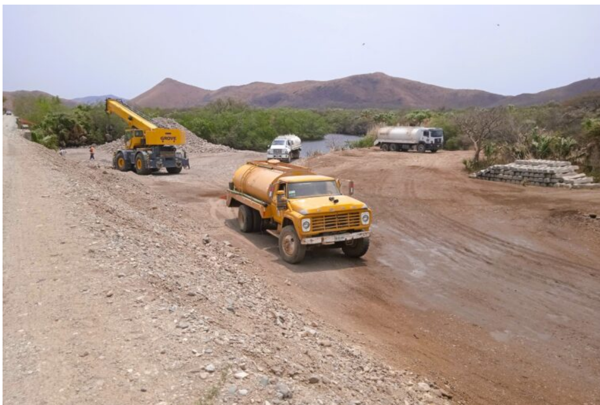
Camiones en las obras para rehabilitar la vía férrea que pasa por Unión Hidalgo, en el punto del estero Espantaperro.