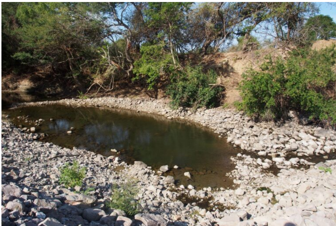
Arroyo de la comunidad Unión Hidalgo, obstruido por el material de construcción y rehabilitación de la Línea K del Tren Interoceánico.

Un año y cuatro meses después de iniciada la modernización de la línea ferroviaria, Mongabay Latam pudo corroborar que en la zona se observa deforestación, decenas de arroyos y cuerpos de agua desviados o rellenos de piedras, aves migratorias sin la posibilidad de pescar para alimentarse, extinción de manglares y la reserva comunal El Palmar visiblemente afectada.