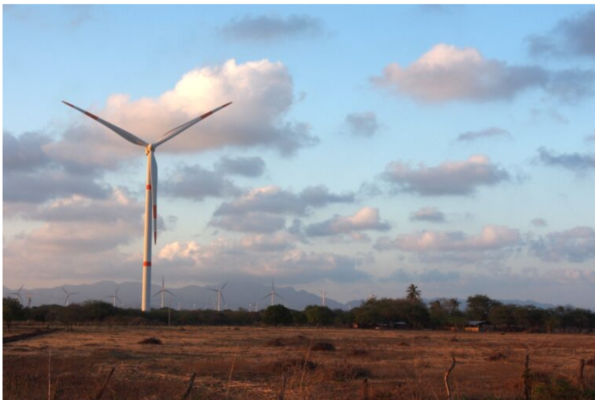
Las turbinas eólicas en tierras comunales de Unión Hidalgo.

Juan Regalado, uno de los firmantes, solicitó tiempo después un crédito bancario y se dio cuenta de que sus tierras estaban hipotecadas por Demex, por lo que, junto a otros poseionarios inconformes, inició un proceso legal para anular el contrato.