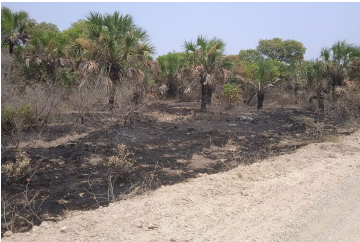
Impactos denunciados por la comunidad en la Reserva El Palmar.

Por su parte, las autoridades mexicanas aseguran que los encargados de las obras “Rehabilitación de las vías de la línea K” y de los puentes informan que no existe uso de material peligroso desecante en contacto con el agua. “No existe reporte de accidente o vertimiento de algún producto químico que se hubiese vertido accidentalmente en el agua de los puentes”, insisten.