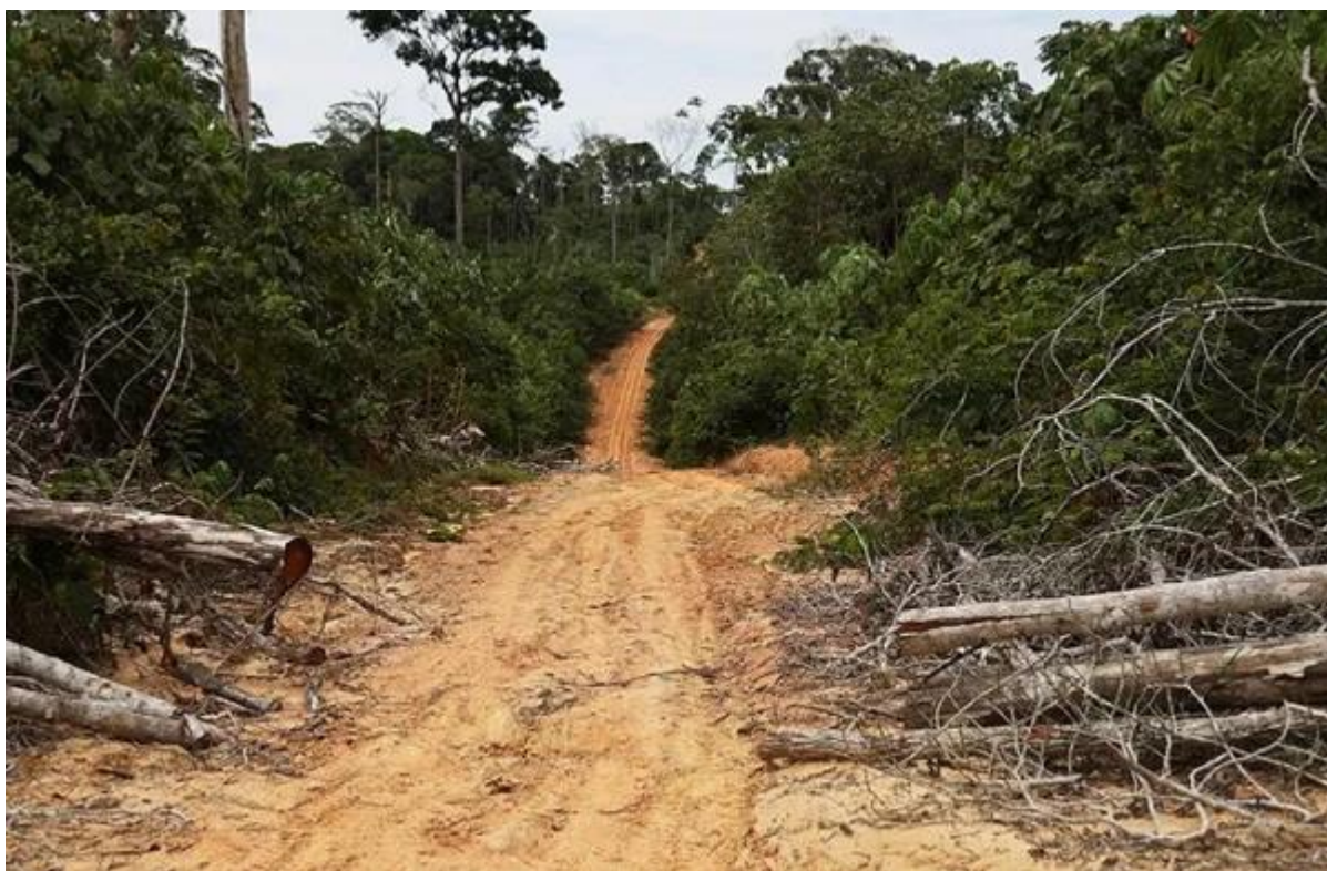
Imagen referencial de una carretera en la Amazonia.

La carretera Tournavista-Iparía es aún una trocha carrozable, pero ya es utilizada por taladores ilegales y agricultores cocaleros. A su paso, además, divide a 2 comunidades indígenas y afecta a una tercera.