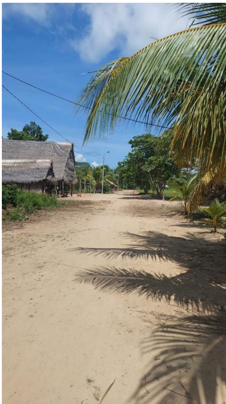
Comunidad nativa Nueva Esperanza de Tabacoa.

Si bien por esta comunidad no pasa la carretera, el jefe de la comunidad reportó la presencia de taladores ilegales, así como de agricultores y personas extrañas.