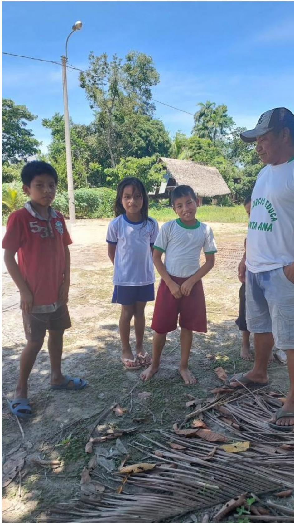
Comunidad nativa Atahualpa de Tabacoa.