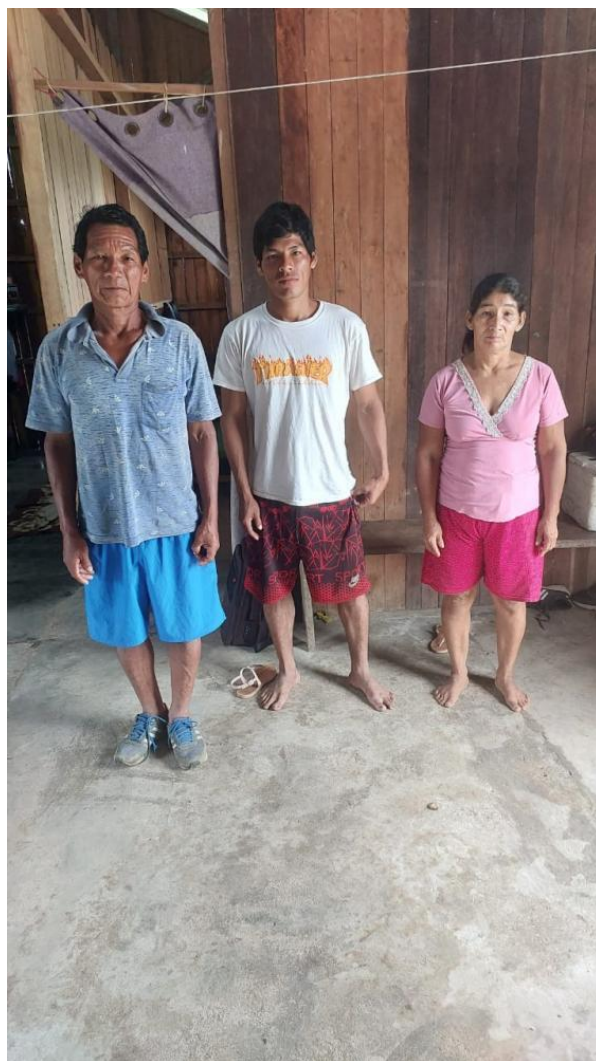
Jefe de la comunidad nativa Bellavista.

La autoridad también contó que han visto agricultores, probablemente cocaleros, que usan campamentos y trochas que dejan los madereros ilegales. También se ven personas extrañas caminando por el lugar, añadió.