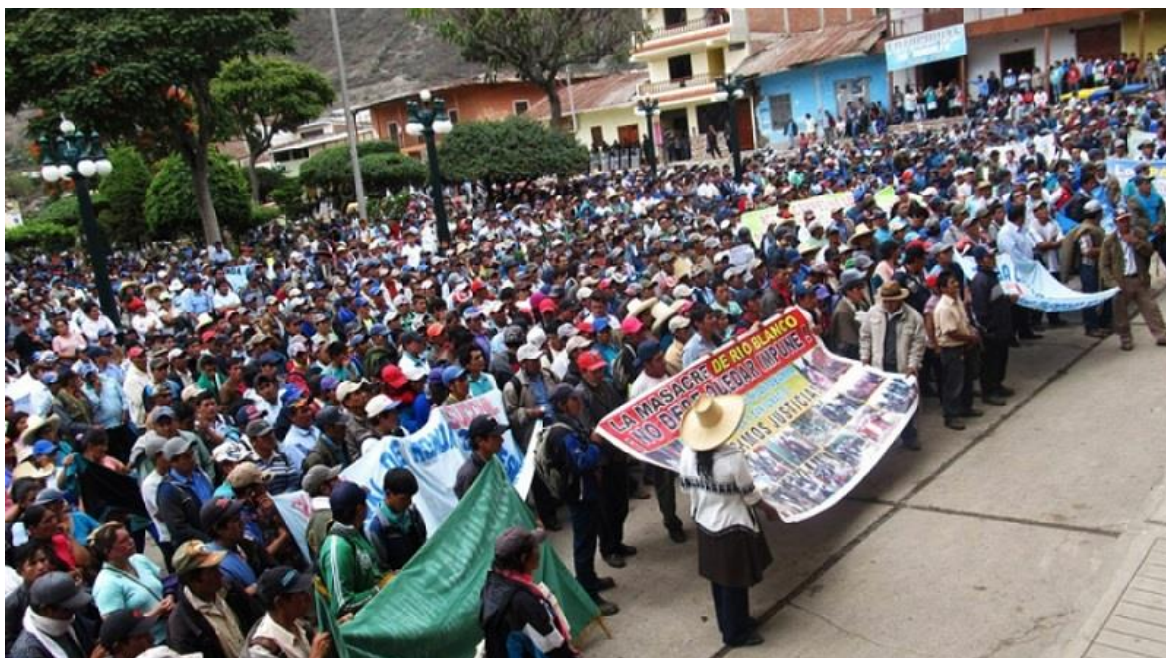
Comunidades de Piura en movilización.

Servindi, 2 de noviembre, 2017.- Por ilegal, inconstitucional y lesivo a los derechos colectivos de 136 comunidades campesinas de la región Piura asociaciones sociales y civiles piden archivar el Proyecto de Ley 1910.